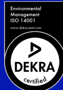
Label pour la gestion de l'Environnement