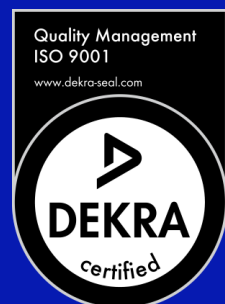
Label pour la gestion de la Qualité